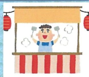
たい焼き・カレー等