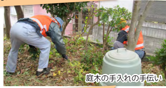
庭木の手入れの手伝い