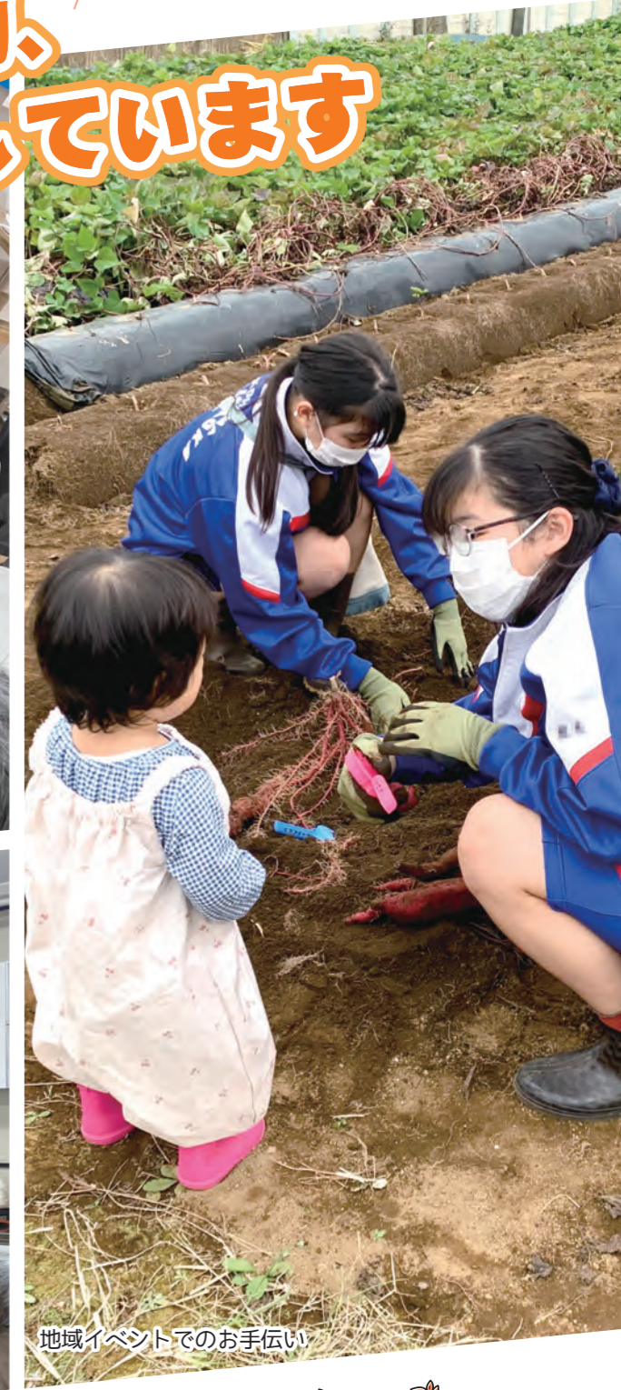
地域イベントでのお手伝い