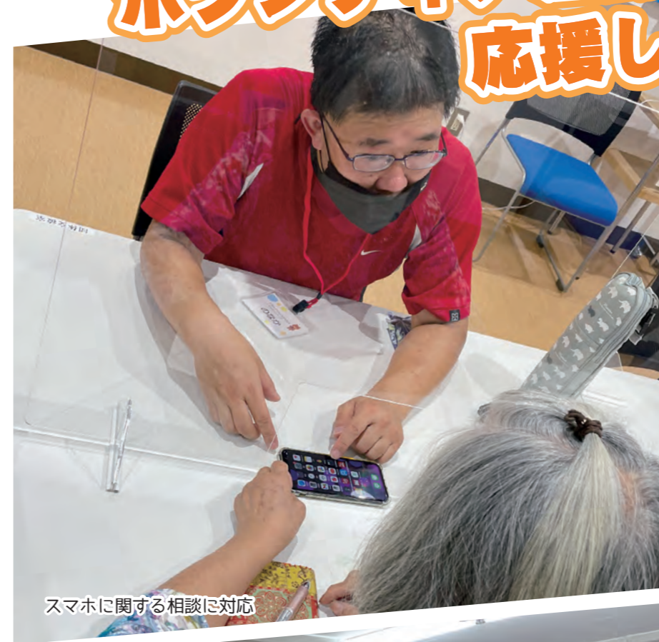
スマホに関する相談に対応