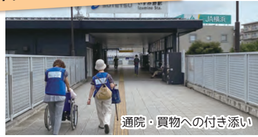
通院・買物への付き添い