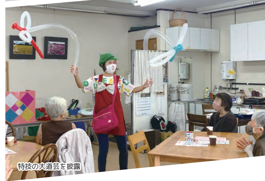
特技の大道芸を披露