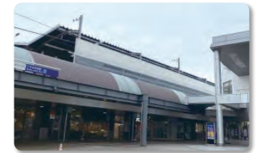
相鉄線いずみ野線「いずみ中央駅」下車すぐ いずみ中央相鉄ライフM3階