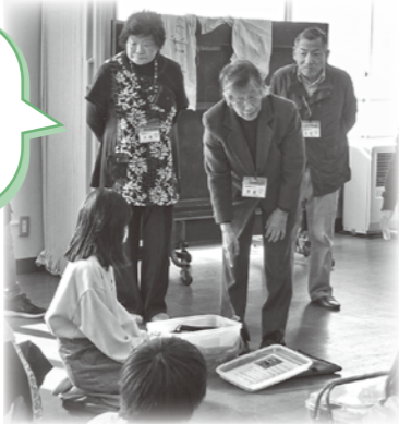
高齢者疑似体験の様子

子どもたちとかかわる機会を通して、私たちも元気をもらっています。体験後の小中学生からいただく感想が楽しみです。