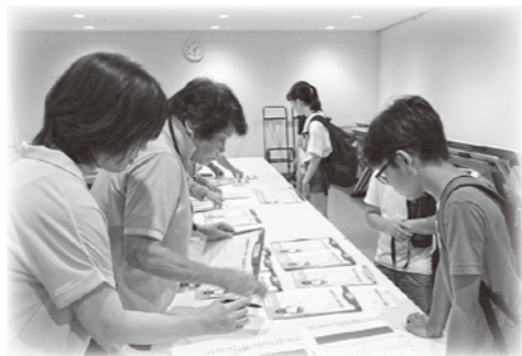
サマースクールでの受付のお手伝い