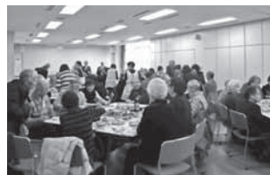
会話も弾み、会場は大賑わい!