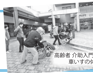
高齢者 介助入門講座にて… 車いすの体験中