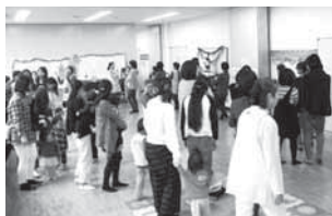
親子の笑顔が溢れています!