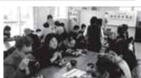
みんなで楽しく食べると いったいおいしいお弁当です。

開催日：毎月第2月曜日 場所：第1集会所・第3集会所 対象者：70歳以上 新しい食事会は、お弁当を皆さんで楽しくお話ししながら食べる食事会です。みそ汁もつきます。来られない方のためには配達もしています。参加者は9月に65名、12月には75名となっております。今後も参加者が増えると思います。