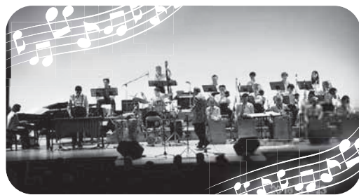
踊り出したくなるようなラテンのリズム