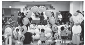
たくさんの風船に子どもたちも大喜び

開催日：平成28年10月20日(木) 場所：緑園地域交流センター 対象：緑園地区子育てグループ 緑園子育て支援及び親と子の居場所「ぐりん」のイベントとして開催されました。会場は親子と風船でいっぱいになり、大賑わい。あつという間のひとときでした。