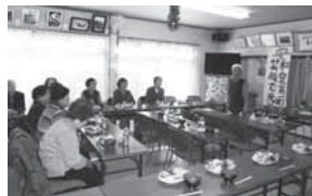
みんな手作りのクリスマス会です。

開催日：毎週木曜日 9~12時 場所：和泉第一町内会館 対象：和泉第一町内会在住 65歳以上の高齢者 地区社協が支援し、高齢者がおしゃべり等楽しむ居場所の提供は8年目に入り、年間50回を数えます。時には軽食もあり、クリスマス会なども楽しめます。