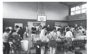
会場は多くの人で賑わっています。

開催日：平成28年7月23日(土) 場所：いずみ野小学校 内容：いずみ野夏祭りと同時に「第29回福祉バザー」を開催しました。毎年多くの方々からバザー品のご提供を頂き、売上は活動の貴重な財源となっています。