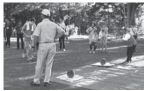
見事にすいか割れました (!?)

開催日：平成28年7月29日(金) 場所：泉中央公園 対象：障がい者施設利用者 和泉中央地区内障がい者施設の利用者と夏の夕方散歩をしながら公園に集まり、花火とすいか割りを楽しみました。60人以上の参加で毎年行っています。