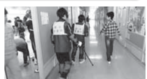
手足におもりをつけて 実際に杖を使って歩いてみました。

開催日：平成28年12月6日(火) 場所：飯田北いちよう小学校 (人権課題強化月間にて) 内容：高齢者の抱えている問題を小学生が疑似体験具を身につけて高齢者の身になり、いたわりの気持ちで接してもらう事を目的とした授業にサポート役に参加しました。