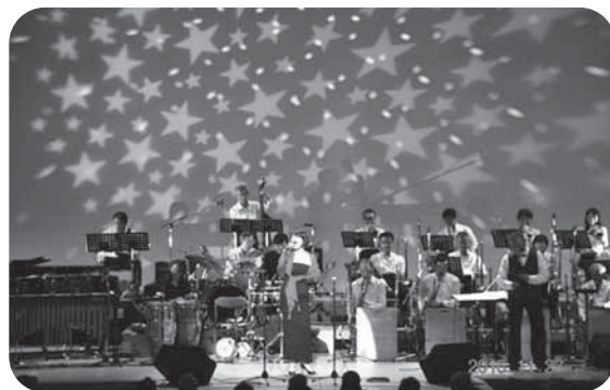
会場を包みこむロマンティックな星空の照明

ビッグバンドによるスケールの大きな演奏と、舞台、照明、観客の熱気が一体となり、今年も素晴らしいコンサートとなりました。