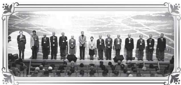
舞台挨拶に臨む実行委員会の方々

11月23日の勤労感謝の日に、「第8回泉区福祉チャリティーコンサート」が泉公会堂で開催されました。恒例となったこのコンサートは、泉区内12の地区社会福祉協議会(※)が実行委員会形式で主催、泉区役所と泉区社会福祉協議会が共催し行われています。