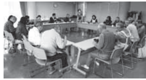
この日はおいしい芋煮大会目指して 予行演習を行いました。

内容：第3期地域福祉保健計画の新規事業「里山プロジェクト」がスタートします。みんなで楽しい里山づくりを推進し、おいしい芋煮大会を目指して頑張ります。