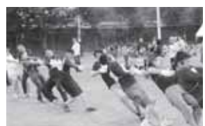
応援にも熱が入る綱引きです。

開催日：平成28年10月10日(月) 場所：領家中学校校庭 対象：しらゆり連合自治会5町内会 天候の都合で1日延び、10月10日素晴らしい秋晴れの中で、5町内会対抗大運動会が行われました。綱引きや、シニアクラスの宝釣りなど、約600名の参加があり楽しみました。