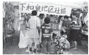
可愛い浴衣姿で何をとっているのかな

開催日：平成28年8月6日(土)、9月18日(日) 場所：下和泉小学校、地区センター 対象：幼稚園児、小学生、父兄、シニアクラブ他地域の皆さん 下和泉地区社協は連合町内会と共催でサマーフェスティバル&盆踊り大会、敬老会等で支え合いの輪、笑顔で健康なまちを目指して皆で努力しています。