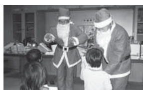
子どもに大人気のサンタさんです。

内容：クリスマスシーズンになると、子育てサロン、親子サークル、障害児団体等からサンタクロースの出前要請が多くなります。中田地区社協では3名の専属サンタがスタンバイ。出前に大忙しです。