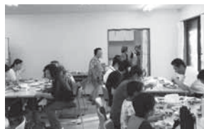
おしゃべりしながら、楽しい食事のひとときです。

開催日：毎月第3金曜日 場所：新橋連合自治会館 対象：新橋町にお住まいの方 幼児からお年寄りの方まで、みんな一緒にわいわい楽しく食事をしたり、夕方に子どもが安心して過ごせる場です。小中学生が勉強する場も提供しています。