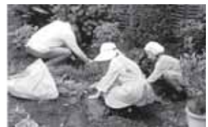
心のこもったお手伝い

内容：上飯田連合地区の一人暮らし高齢者、身体の不自由な方、子育て中のお母さん等を対象に草取り、庭木の剪定や水やり、子どもの見守り等を行います。