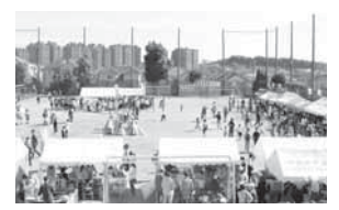
青空の下、盛大に開催されました。

開催日: 27年10月25日(日) 場所: 緑園西小学校 内容: 地域住民と各種団体が参加して開催する秋の緑園地区最大のお祭り、幼児や小中高大学生からお年寄りまでの全世代が集い「ふれあい」を楽しみました。