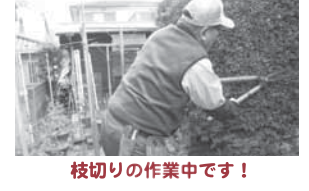
枝切りの作業中です!

内容: 高齢者の多いしらゆり地区で、「チョットお手伝い」を検討して2年。自治会・町内会の会員の70歳以上の高齢者を対象に、昨年の12月1日より実現の運びになりました。雑草取りをはじめ10種類の手助けをします。