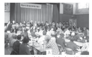
コーラスに聴き入る参加者の皆さん

開催日: 27年10月25日(日) 場所: いずみ野小学校 内容: 70歳以上の自治会会員170名以上の方々にご参加頂き、コーラスや寸劇、マンドリン演奏などでお楽しみ頂きました。今年は花泉会の方々に踊りをご披露頂きました。