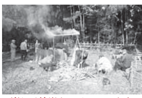
楽しく竹炭をつくっています。

内容: 地域に豊富にある竹材を利用しようと同好の士が集まり、始めました。機材や道具を持ち寄ってドラム缶で窯を手作りしました。焼いた竹炭は無償で配布しています。