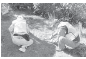
お揃いのユニフォームで活動中!

内容: 中川地区の高齢者・障がい者世帯を対象に、6月より活動したライフサポート隊は、月平均4回出勤しています。現在男女35名の方がサポート隊に登録されています。あなたも参加してみませんか。