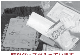
防災グッズが入っています。

内容: これまで見守りの対象となりにくかった方々(75才以上で昼間一人暮らし、または二人とも75才以上の方)を中心に防災グッズの入った袋を渡して、年3回交換補充を兼ねて訪問します。