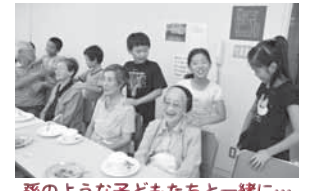
孫のような子どもたちと一緒に...

内容: 「笑顔で健康なまち」下和泉地区は第3期泉区地域福祉保健計画で健康づくりに取り組めます。健康長寿を延ばすための場や機会を増やし、自分から挨拶して向こう三軒両隣の関係を深めましょう。