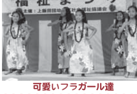
可愛いフラガール達

開催日: 27年5月31日(日) 場所: 上飯田団地第1集会所 内容: 当日は約800名が参加し、各ボランティアグループが祭りを盛り上げてくれました。70歳以上の約200名に祭りで利用できる100円券を配付し、楽しんで頂きました。