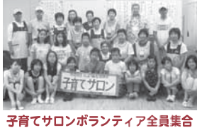
子育てサロンボランティア全員集合!

開催日: 27年7月23日(木) 場所: 葛野コミュニティハウス 内容: 毎年夏休みになると地域活動ボランティア研修として、区内の小中学校生徒対象の「子育てサロン研修」を開催します。今年は男女13名が参加しました。