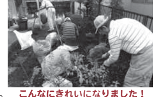
こんなにきれいになりました!

内容: 上飯田地区の一人暮らし高齢者、身体の不自由な高齢者などを対象に、草むしり、垣根の小枝切り等のお手伝い。「春の多忙な時に、こんなにきれいにしてお下りありがとうございます」の一言にメンバーの笑顔が美しくこぼれました。