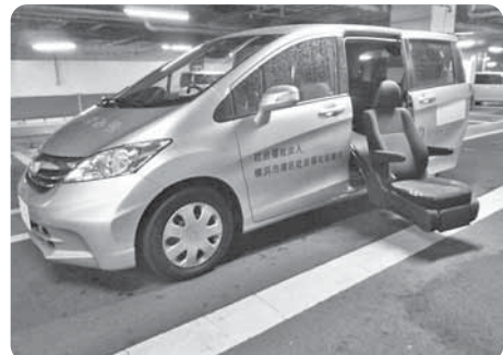
座席が回転します