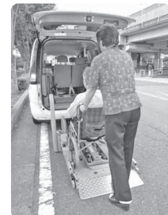
車イスごと乗車します

公共交通機関等の利用が困難な方を対象に、泉区社協の福祉車両を使用して、運転ボランティアが病院等への送迎を行います(介助は含みません)。