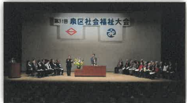
第31回泉区社会福祉大会の様子