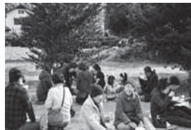
いも煮は大好評! 多くの住民が里山に集まりました。

開催日:平成29年11月26日(日) 場所:里山夢プロジェクト「畑」 対象:地域の子どもから大人、お年寄り、障がい者の皆さん 内容:みんなで楽しい里山づくりを合言葉に、育てた野菜で、「いも煮会」を開催。子ども、老人ホームのお年寄り等も入って110余名が参加し、民生委員・地区社協の女性軍が2日掛りで調理した、東北の本格味に、舌つづみを打ちました。