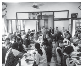
参加者の皆さんで食卓を囲みました。

開催日:平成29年10月5日(木) 場所:三家自治会館 対象:地域の一人暮らし高齢者、シニアクラブの会員等 内容:毎年1回10月に手作り料理によるふれあい食事会を開催しています。約70名の方々にご参加頂き、短い時間ではありましたが、手作りの食事とビンゴゲーム、カラオケなどでお楽しみいただきました。