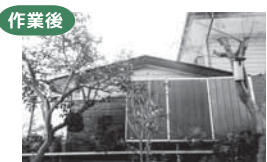
隣の家が見えないほどでしたが、作業終了後は、すっきりしました。