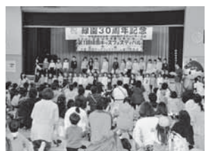
「つながり」づくりの第一歩となりました!

開催日:平成29年11月12日(日) 場所:緑園地域交流センター 対象:未就学児童とその保護者兄弟 内容:この催しは、支え合い・助け合いが生きる元気の街を目指し、子育てを支援し、安心して子育てができる、一人で悩まない環境をつくることで、「子育てのつながり」の契機になればと企画、300名超の参加者でにぎわいました。