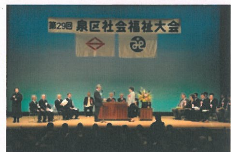
第29回 泉区社会福祉大会の様子

お問合せ：泉区社会福祉協議会 TEL:802-2150 FAX:804-6042