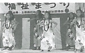
可愛いフラガール達

開催日：27年5月31日(日) 場所：上飯田団地第1集会所 内容：当日は約800名が参加し、各ボランティアグループが祭りを盛り上げてくれました。70歳以上の入居者約200名に祭りで見られる100円券を配付し、楽しんで頂きました。