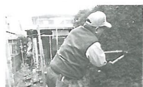
枝切りの作業中です!

内容：高齢者の多いしらゆり地区で、「チョットお手伝い」を検討して2年。自治会・町内会の会員の70歳以上の高齢者を対象に、昨年の12月1日より実現の運びになりました。雑草取りをはじめ10種類の手助けをします。