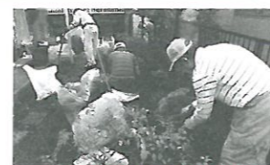
こんなにきれいになりました!

内容：上飯田地区の一人暮らし高齢者、身体の不自由な高齢者などを対象に、草むしり、垣根の小枝切り等のお手伝い。「春の多忙な時に、こんなにきれいにして下さりありがとうございます」の一言にメンバーの笑顔が美しくこぼれました。