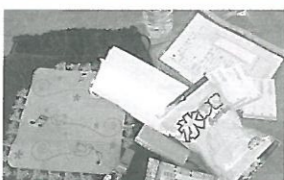
防災グッズが入っています。

内容：これまで見守りの対象となりにくかった方々(75才以上で昼間一人暮らし、または二人とも75才以上の方)を中心に防災グッズの入った袋を渡して、年3回交換補充を兼ねて訪問します。