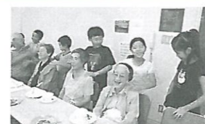
孫のような子どもたちと一緒に...

内容：「笑顔で健康なまち」下和泉地区は第3期泉区地域福祉保健計画で健康づくりに取り組みます。健康長寿を延ばすための場や機会を増やし、自分から挨拶して向こう三軒両隣の関係を深めましょう。