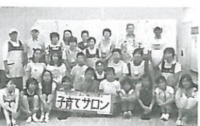
子育てサロンボランティア全員集合!

開催日：27年7月23日(木) 場所：葛野コミュニティハウス 内容：毎年夏休みになると地域活動ボランティア研修として、区内の小中学校生徒対象の「子育てサロン研修」を開催します。今年は男女13名が参加しました。