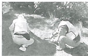
お揃いのユニフォームで活動中!

内容：中川地区の高齢者・障がい者世帯を対象に、6月より活動したライフサポート隊は、月平均4回出勤しています。現在男女35名の方がサポート隊に登録されています。あなたも参加してみませんか。