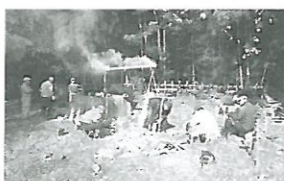
楽しく竹炭をつくっています。

内容：地域に豊富にある竹材を利用しようと同好の士が集まり、始めました。機材や道具を持ち寄ってドラム缶で窯を手作りしました。焼いた竹炭は無償で配布しています。