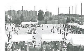
青空の下、盛大に開催されました。

開催日：27年10月25日(日) 場所：緑園西小学校 内容：地域住民と各種団体が参加して開催する秋の緑園地区最大のお祭りで、幼児や小中高大学生からお年寄りまでの全世代が集い「ふれあい」を楽しみました。